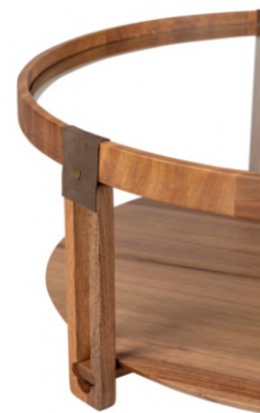
DETALHES EM COURO NATURAL. DETAILS IN NATURAL LEATHER. DETALLES EN CUERO NATURAL.

CxPxA / medidas em mm LxDxH / measures in mm CxPxA / medidas em mm