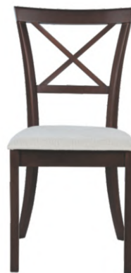
FOTO DO PRODUTO EM TR035. TECIDO 0015562. PICTURE UNIT IN TR035. FABRIC 0015562. FOTO DEL PRODUCTO EN TR035. TEJIDO 0015562.

CxPxA / medidas em mm LxDxH / measures in mm CxPxA/ medidas en mm