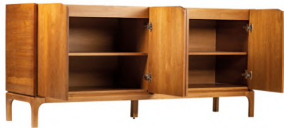
FOTO DO PRODUTO EM TR036. PHOTO OF THE PRODUCT IN TR036. FOTO DEL PRODUCTO DE TR036.