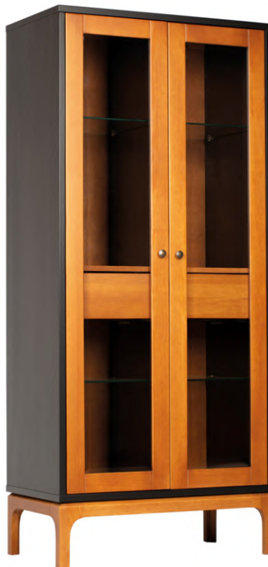
FOTO DO PRODUTO: PORTAS, PÉS E GAVETAS EM TR001. CORPO EM TR009. PICTURED UNIT: DOORS, LEGS AND DRAWERS IN TR001. FRAME IN TR009 FOTO DEL PRODUCTO: PUERTAS, PATAS Y CAJONES DE TR001. CUERPO DE TR009.

CxPxA / medidas em mm LxDxH / measures in mm CxPxAv / medidas en mm