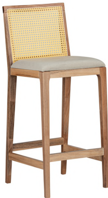
FOTO DO PRODUTO EM JEQUITIBÁ NATURAL. TECIDO 0014877.PALHA ABERTA PICTURE UNIT IN WOOD JEQUITIBÁ. FABRIC 0014877.OPEN STRAW. FOTO DEL PRODUCTO DE JEQUITIBÁ NATURAL. TEJIDO 0014877.PAJA ABIERTA.