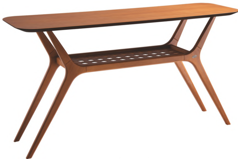
FOTO DO PRODUTO EM TR001. PHOTO OF THE PRODUCT IN TR001. FOTO DEL PRODUCTO DE TR001.

CxPxA / medidas em mm LxDxH / measures in mm CxPxA / medidas en mm