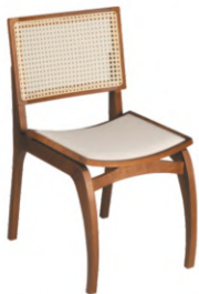
FOTO DO PRODUTO EM TR036. TECIDO 0014877. PICTURE UNIT IN TR036. FABRIC 0014877. FOTO DEL PRODUCTO DE TR036. TEJIDO 0014877.