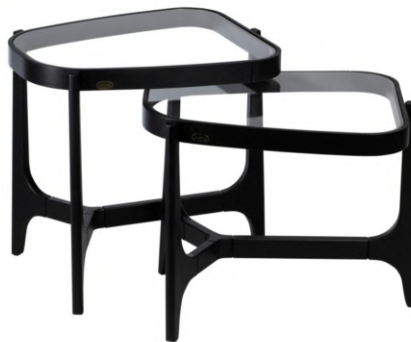
FOTO DO PRODUTO EM TR009. PHOTO OF THE PRODUCT IN TR009. FOTO DEL PRODUCTO DE TR009.

CxPxA / medidas em mm LxDxH / measures in mm CxPxA / medidas en mm