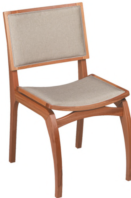
FOTO DO PRODUTO EM JEQUITIBÁ NATURAL. TECIDO 0031008. PICTURED UNIT IN NATURAL JEQUITIBÁ. FABRIC 0031008. FOTO DEL PRODUCTO DE JEQUITIBÁ NATURAL. TEJIDO 0031008.

FOTO DO PRODUTO EM TR036. TECIDO 0014877. PICTURE UNIT IN TR036. FABRIC 0014877. FOTO DEL PRODUCTO DE TR036. TEJIDO 0014877.