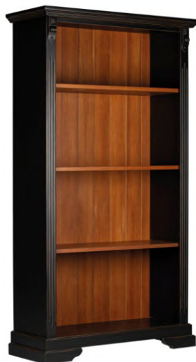
FOTO DO PRODUTO: PRATELEIRAS E FUNDO EM TR001. CORPO EM TR009.COM DESGASTE PICTURE UNIT: SHELVES AND BACKGROUND IN TR001. FRAME IN TR009.WHITH DETAILS. FOTO DEL PRODUCTO: ESTANTERÍAS Y ANTECEDENTES DE TR001. CUERPO DE TR009. CON DESGASTE.

FOTO DO PRODUTO: TAMPO, PRATELEIRAS, BASE E FUNDO EM TR001.CORPO EM TR055. PICTURE UNIT: TOPSHELVES, BASE AND BACKGROUND IN TR001. FRAME IN TR055. FOTO DEL PRODUCTO: TABLERO, ESTANTERÍAS, BASE Y ANTECEDENTES DE TR001.CUERPO DE TR055.