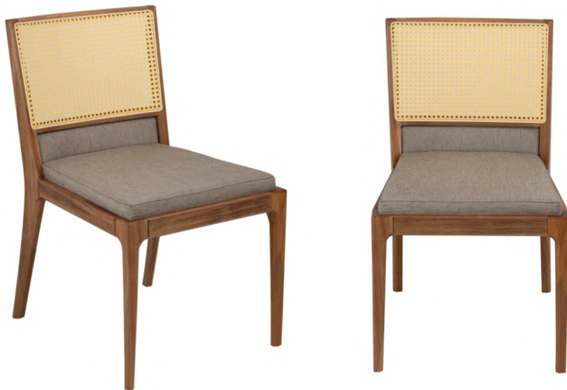
FOTO DO PRODUTO EM JEQUITIBÁ NATURAL. TECIDO 0016242. PALHA ABERTA. PICTURE UNIT IN JEQUITIBÁ WOOD. FABRIC 0016242. PEN STRAW. FOTO DEL PRODUCTO EN JEQUITIBÁ NATURAL. TEJIDO 0016242. PAJA ABIERTA.