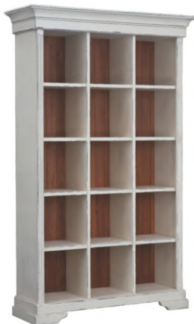
FOTO DO PRODUTO: CORPO EM TR063. FUNDO EM TR001.COM DESGASTE PICTURE UNIT: FRAME IN TR063. BACK PANEL IN TR001.WHITH DETAILS. FOTO DEL PRODUCTO: CUERPO DE TR063. TRASERA DE TR001. CON DESGASTE.

CxPxA / medidas em mm LxDxH / measures in mm CxPxA/ medidas em mm