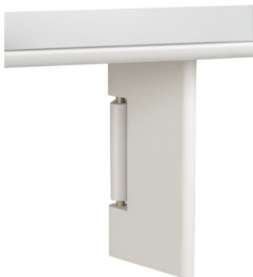
FOTO DO PRODUTO EM TR051 COM VIDRO OFF WHITE PICTURED UNIT IN TR051 WITH GLASS OFF WHITE FOTO DEL PRODUCTO DE TR051 CON VIDRIO OFF WHITE