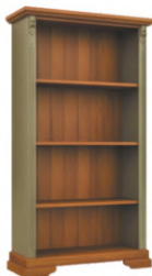
FOTO DO PRODUTO: TAMPO, PRATELEIRAS, BASE E FUNDO EM TR001.CORPO EM TR055. PICTURE UNIT: TOPSHELVES, BASE AND BACKGROUND IN TR001. FRAME IN TR055. FOTO DEL PRODUCTO: TABLERO, ESTANTERÍAS, BASE Y ANTECEDENTES DE TR001.CUERPO DE TR055.

CxPxA / medidas em mm LxDxH / measures in mm CxPxA/ medidas em mm