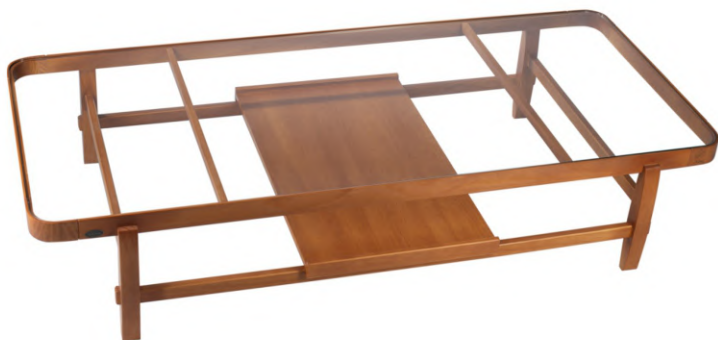
FOTO DO PRODUTO EM TR001. PHOTO OF THE PRODUCT IN TR001. FOTO DEL PRODUCTO DE TR001.