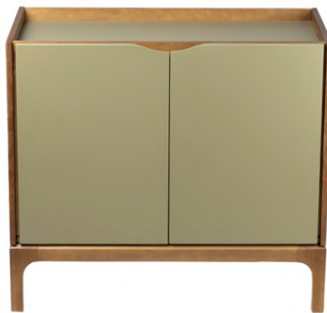
FOTO DO PRODUTO: PÉS E CORPO EM TR036. PORTAS E TAMPO EM TR055. PICTURED UNIT: DEET AND BODY IN TR036. DOORS AND TOP IN TR055 FOTO DEL PRODUCTO: PIES Y PUERTAS DE TR036. PUERTAS Y TECHO DE TR055.

FOTO DO PRODUTO EM TR036. PHOTO OF THE PRODUCT IN TR036. FOTO DEL PRODUCTO DE TR036.