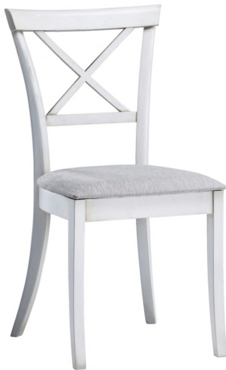
FOTO DO PRODUTO EM TR063 COM DESGASTE. TECIDO 0031009. PICTURE UNIT IN TR063 WITH DETAILS. FABRIC 0031009. FOTO DEL PRODUCTO DE TR063 CON DESGASTE. TEJIDO 0031009.