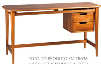
FOTO DO PRODUTO EM TR036. PHOTO OF THE PRODUCT IN TR036. FOTO DEL PRODUCTO DE TR036.