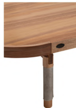
DETALHES EM COURO NATURAL. DETAILS IN NATURAL LEATHER. DETALLES EN CUERO NATURAL.