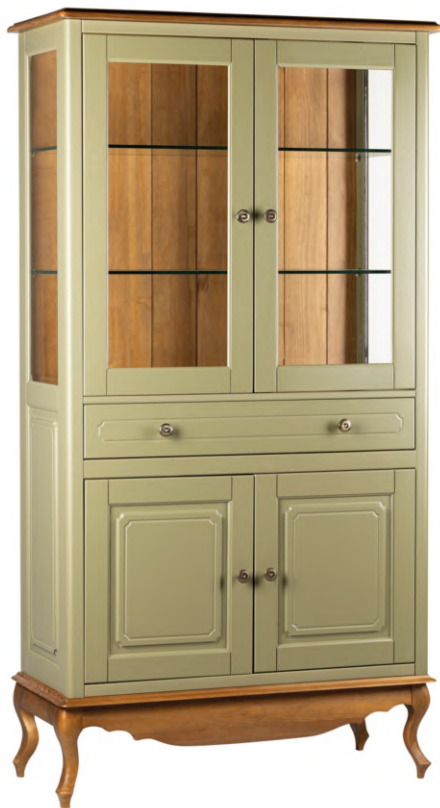
FOTO DO PRODUTO: CORPO EM TR055. PÉS, FUNDO E TAMPO EM TR036. PRODUCT PHOTO: BODY IN TR055. FEET, BACKGROUND AND TOP IN TR036. FOTO DEL PRODUCTO: CUERPO EN TR055. PIES, FONDO Y SUPERIOR EN TR036.