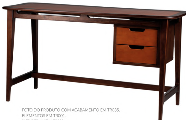
FOTO DO PRODUTO COM ACABAMENTO EM TR035. ELEMENTOS EM TR001. PICTURED UNIT IN TR035. PARTS IN TR001. FOTO DEL PRODUCTO CON ACABADO DE TR035. DETALLES DE TR001.

FOTO DO PRODUTO EM TR036. PHOTO OF THE PRODUCT IN TR036. FOTO DEL PRODUCTO DE TR036.