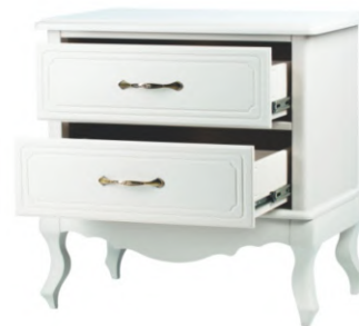
FOTO DO PRODUTO EM TR063. PICTURE UNIT IN TR063. FOTO DEL PRODUCTO DE TR063.