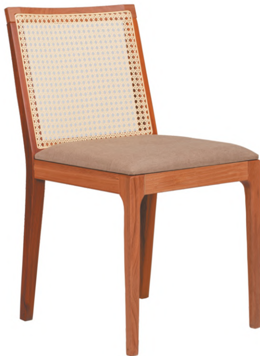
FOTO DO PRODUTO JEQUITIBÁ NATURAL. TECIDO 0031017. PALHA ABERTA. PICTURE UNIT IN JEQUITIBA WOOD. FABRIC 0031017. PEN STRAW. FOTO DEL PRODUCTO EN JEQUITIBÁ NATURAL. TEJIDO 0031017. PAJA ABIERTA.