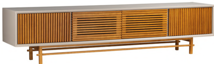
FOTO DO PRODUTO: CAIXA EM TR052, PORTAS E PÉS EM TR001. PRODUCT PHOTO: BOX IN TR052, DOORS AND FEET IN TR001. FOTO DO PRODUCTO: CAJA EN TR052, PUERTAS Y PIES EN TR001.

CxPxA / medidas em mm LxDxH / measures in mm CxPxH / medidas en mm