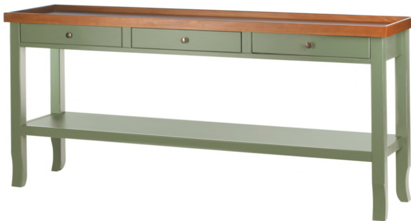
FOTO DO PRODUTO: PÉS E GAVETAS EM TR055. TAMPO EM TR062 PICTURED UNIT: LEGS AND DRAWERS IN TR055. TOP IN TR062. FOTO DEL PRODUCTO: PATAS Y CAJONES DE TR055. TABLERO DE TR062.

CxPxA / medidas em mm LxDxH / measures in mm CxPxA / medidas en mm