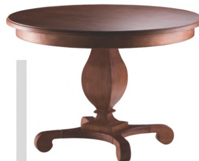
FOTO DO PRODUTO EM EM TR035. PICTURED UNIT IN TR035. FOTO DEL PRODUCTO DE TR035.

CxPxA / medidas em mm LxDxH / measures in mm CxPxA / medidas en mm