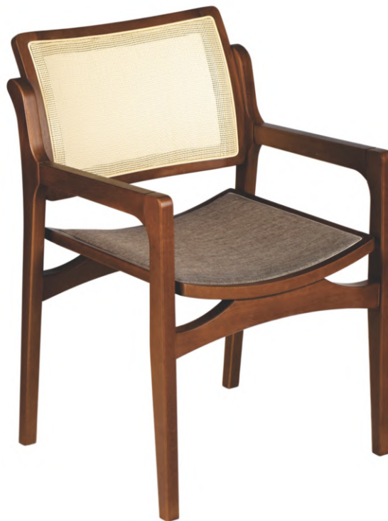
FOTO DO PRODUTO EM TR036. TECIDO 0031011. PALHA FECHADA PICTURED UNIT IN TR036. FABRIC 0031011. CLOSED STRAW. FOTO DEL PRODUCTO DE TR036. TEJIDO 0031011. PAJA CERRADA.

FOTO DO PRODUTO EM TR001. TECIDO 0031008.PALHA ABERTA PICTURE UNIT IN TR001. FABRIC 0031008.OPEN STRAW. FOTO DEL PRODUCTO DE TR001. TEJIDO 0031008.PAJA ABIERTA.