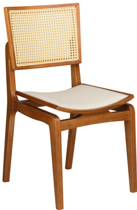
FOTO DO PRODUTO EM TR001. TECIDO 0014877.PALHA ABERTA PICTURE UNIT IN TR001. FABRIC 0014877.OPEN STRAW. FOTO DEL PRODUCTO DE TR001. TEJIDO 0014877.PAJA ABIERTA.