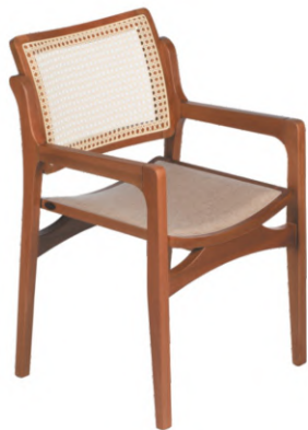
FOTO DO PRODUTO EM TR001. TECIDO 0031008.PALHA ABERTA PICTURE UNIT IN TR001. FABRIC 0031008.OPEN STRAW. FOTO DEL PRODUCTO DE TR001. TEJIDO 0031008.PAJA ABIERTA.

CxPxA / medidas em mm LxDxH / measures in mm CxPxA/ medidas en mm