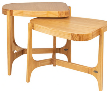
FOTO DO PRODUTO EM TR062. PHOTO OF THE PRODUCT IN TR062. FOTO DEL PRODUCTO DE TR062.