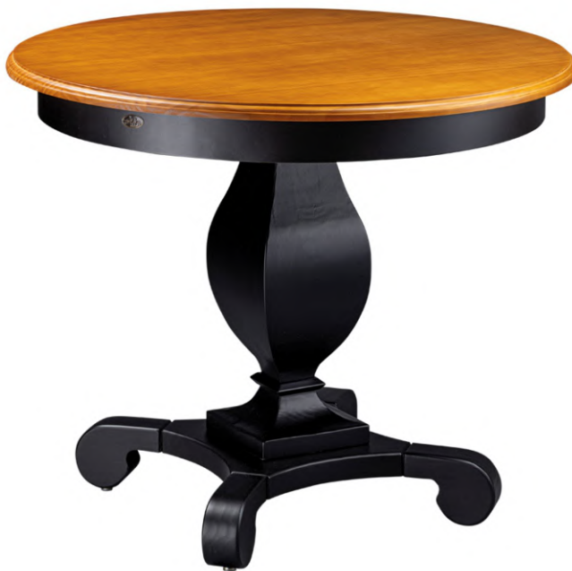
FOTO DO PRODUTO: BASE, COLUNA E SAIA EM TR009. TAMPO EM TR001. PICTURE UNIT: BASE, COLUMN AND SKIRT IN TR009. TOP IN TR001. FOTO DEL PRODUCTO: BASE, COLUMNA Y ENVOLTURA DE TR009. CUBRIR DE TR001.