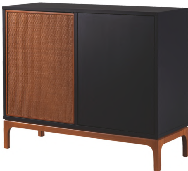
FOTO DO PRODUTO: CORPO E PORTA DIREITA EM TR009. BASE E PORTA ESQUERDA EM TR001. COM RATAN. PICTURED UNIT FRAME AND RIGHT DOOR IN TR009. BASE AND LEFT DOOR IN TR001. WITH RATAN. FOTO DEL PRODUCT: CUERPO Y PUERTA DERECHA DE TR009. BASE Y PUERTA IZQUIERDA DE TR001. CON RATAN.

CxPxA / medidas em mm LxDxH / measures in mm CxPxA / medidas en mm