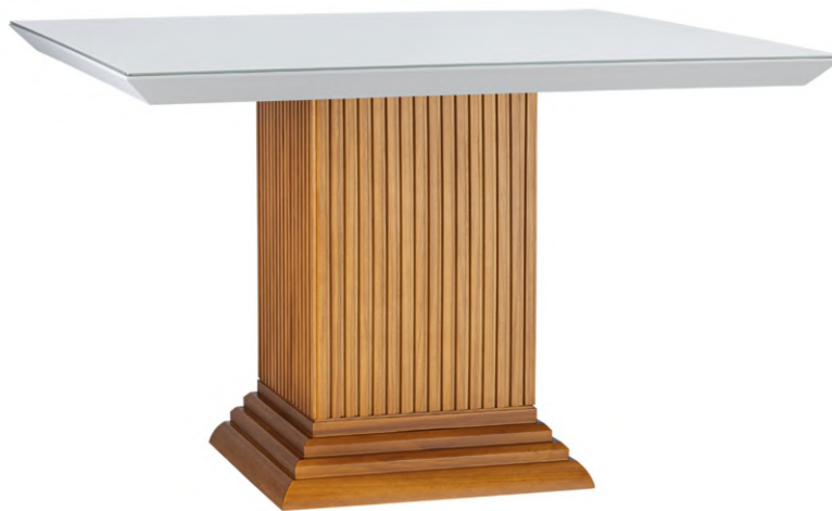
FOTO DO PRODUTO: TAMPO EM TR051 COM VIDRO OFF WHITE. PÉ EM TR001. PICTURE UNIT: TOP IN TR051 WITH GLASS OFF WHITE. LEG IN TR001. FOTO DEL PRODUCTO: TABLERO DE TR051 CON VIDRIO OFF WHITE. PATA DE TR001.

CxPxA / medidas em mm LxDxH / measures in mm CxPxA/ medidas en mm