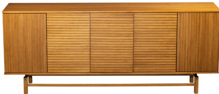
FOTO DO PRODUTO EM TR001. PRODUCT PHOTO IN TR001. FOTO DO PRODUTO EN TR001.