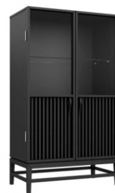
FOTO DO PRODUTO EM TR009 PHOTO OF THE PRODUCT IN TR009 FOTO DEL PRODUCTO EN TR009

CxPxA / medidas em mm LxDxH / measures in mm CxPxA / medidas en mm