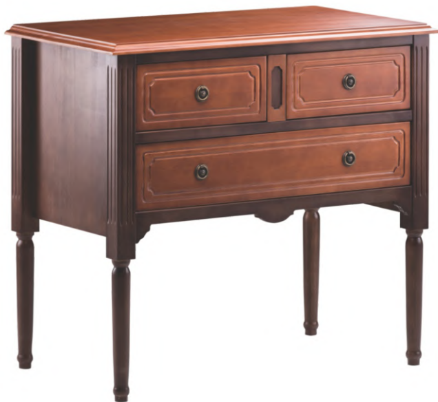
FOTO DO PRODUTO: TAMPO E GAVETAS EM TR001. CORPO EM TABACO PICTURE UNIT: TOP AND DRAWERS IN TR001. FRAME WITH TOBACCO FINISHING. FOTO DEL PRODUCTO: TABLERO Y CAJONES DE TR001. CUERPO DE COLOR TABACO.