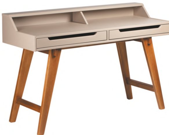
FOTO DO PRODUTO: GAVETEIRO EM TR052. PÉS EM TR036. PICTURE UNIT: DRAWER UNIT IN TR052. LEGS IN TR036 FOTO DEL PRODUCTO: CAJONEIRA DE TR052. PATAS EN TR036.

CxPxA / medidas em mm LxDxH / measures in mm CxPxA/ medidas en mm