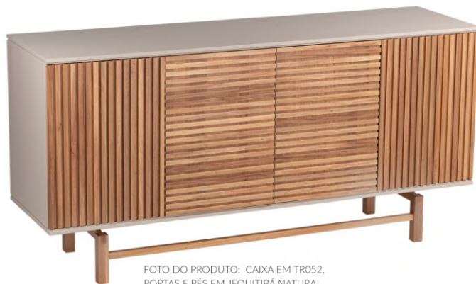
FOTO DO PRODUTO: CAIXA EM TR052. PORTAS E PÉS EM JEQUITIBÁ NATURAL. PRODUCT PHOTO: BOX IN TR052. DOORS AND FEET IN WOOD JEQUETIBÁ FOTO DO PRODUTO: CAJA EN TR052. PUERTAS Y PIES EN JEQUITIBÁ NATURAL.