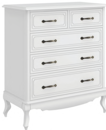
FOTO DO PRODUTO EM TR063. PICTURE UNIT IN TR063. FOTO DEL PRODUCTO DE TR063.