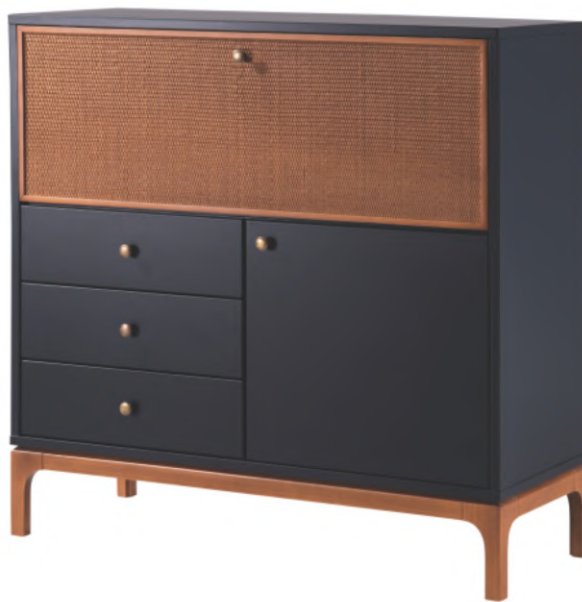
FOTO DO PRODUTO: CORPO, GAVETAS E PORTAS EM TR009. PORTA VASCULANTE E BASE EM TR001. COM RATAN. PICTURED UNIT: FRAME, DRAWERS AND DOORS IN TR009. TILTING DOOR AND BASE IN TR001. WITH RATAN. FOTO DEL PRODUCTO: CUERPO, CAJONES Y PUERTAS DE TR009. PUERTA BASCULANTE Y BASE DE TR001. CON RATÁN

CxPxA / medidas em mm LxDxH / measures in mm CxPxA/ medidas en mm